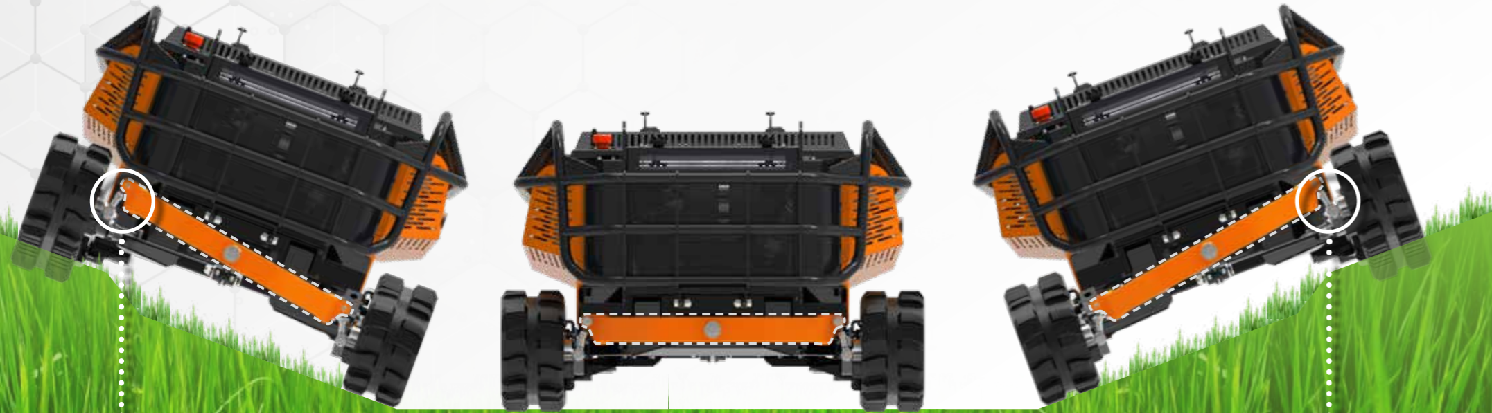
OSCILLAZIONE A SINISTRA LEFT SIDE OSCILLATION

RoboMINI grazie alla sua particolare concezione progettuale: baricentro basso e movimento oscillante dei cingoli , è perfetto per operare in zone sconnesse o su pendii ripidi, mantenendo sempre un ottimo grip in quanto la macchina resta sempre a contatto con la superficie anche in condizioni difficili.