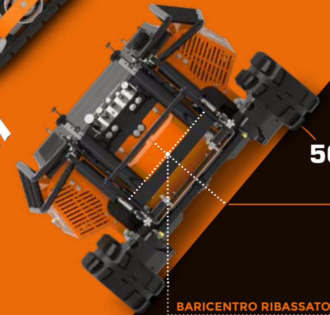
BARICENTRO RIBASSATO LOWERED CENTER OF GRAVITY