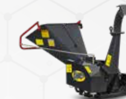
BIO-SHREDDER BIOTRITURATORE BIO-SHREDDER