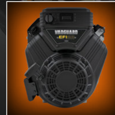
MOTORE A BENZINA DA 23 CV GASOLINE ENGINE 23 HP