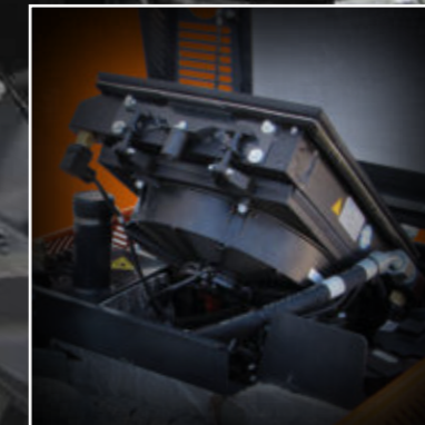
VENTOLA AUTOPULENTE IDRAULICA HYDRAUCIC SELF-CLEANING FAN

RoboMINI è equipaggiato con una ventola autopulente idraulica , per migliorare produttività e risparmio di carburante.