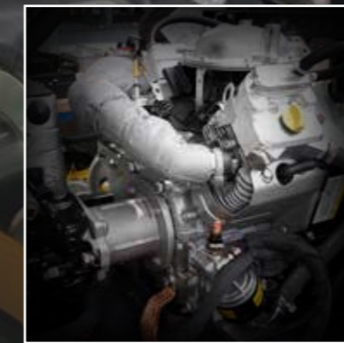
I MIGLIORI COMPONENTI THE BEST COMPONENTS